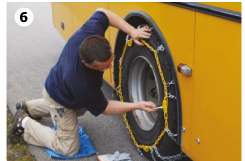
6 Stram kjettingen ved å vri over de 4 cam-locks med vedlagt strammenøkkel