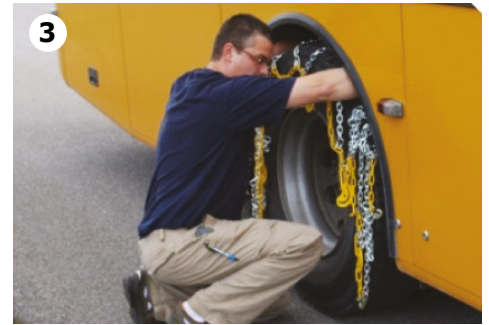
3 og legg den over hjulet