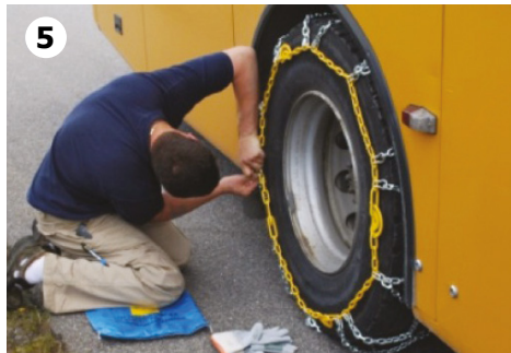
5 Stopp bussen, og fest låsekrok, først innvendig og så utvendig