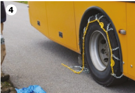
4 Grei ut kjettingen på hjulet og kjør bussen litt fram.