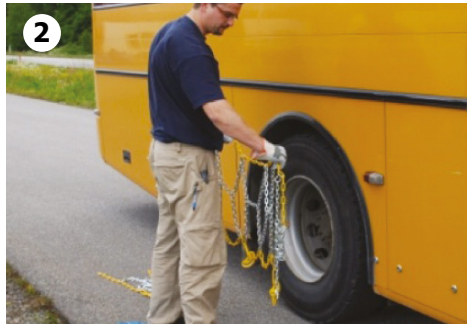
2 Løft kjettingen...