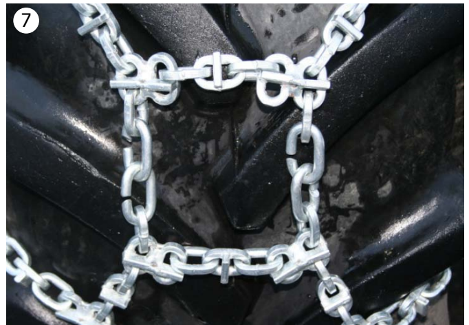
7 Koble sammen de skråskjærte koblingslenkene på hver side som vist.