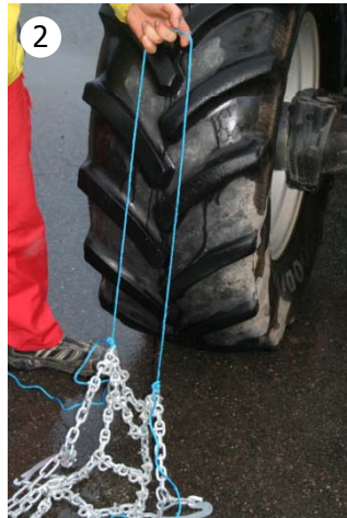
2 Fest et tau på hver side av koblingslenkene.