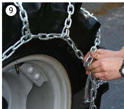
9 Fest siste nedtak til sidekjettingene på hver side med sjakel. Husk å skru sjaklene godt til før kjøring.