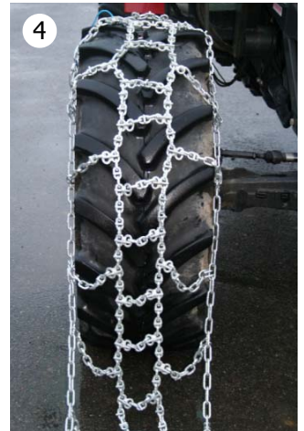
4 Kjør kjettingen sakte på hjulet.