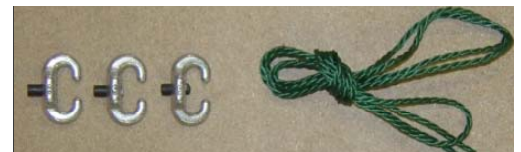
3 stk. stiftkoblinger. Monteringstau og denne monteringsanvisningen følger med hvert par.