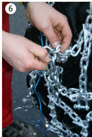
6 Frigjør kransen av skråskjærte koblingslenker.