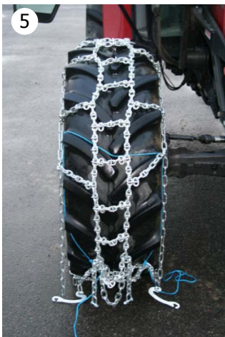
5 Stopp traktoren når kjettinglengdene møtes.