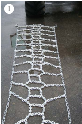
1 Legg ut kjettingen med broddene opp.