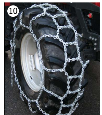
10 Lilleseht Lettkjetting 7mm ferdig montert.