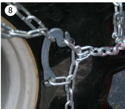
8 Stram kjettingene på hver side med låsearmen som vist. Husk å kutte sidekjettinglenkene som er for lange.